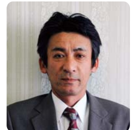
俵 薫 秋芳町中辺