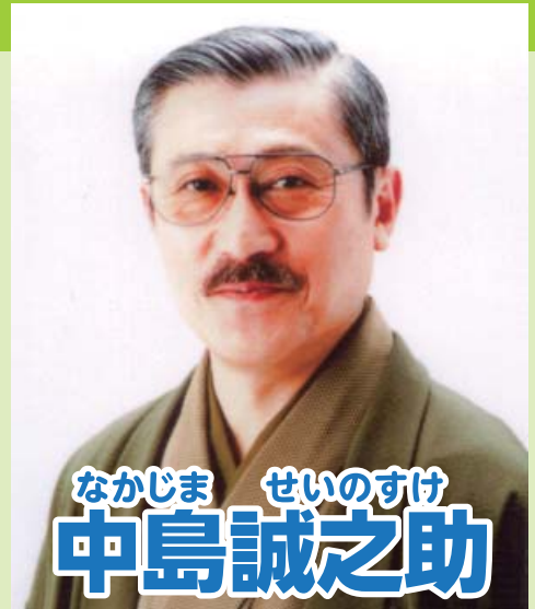
なかじま せいのおすけ 中島誠之助

古美術鑑定家。1938年東京都生まれ。古伊万里など、東洋古陶磁器の魅力を世に広める。テレビ「開運!なんでも鑑定団」に鑑定士としてレギュラー出演し、鋭い鑑定眼と歯切れの良い江戸っ子トークで、お茶の間の人気者に。「いい仕事してますね」の名文句で“ゆうもあ大賞”を受賞。