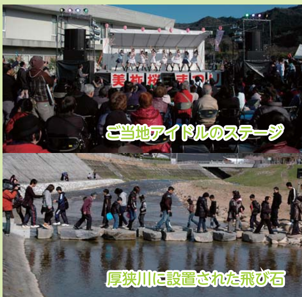
ご当地アイドルのステージ

問合せ先 美祢図書館 ☎0837(52)0213 美東図書館 ☎08396(2)5555 秋芳図書館 ☎0837(62)1925