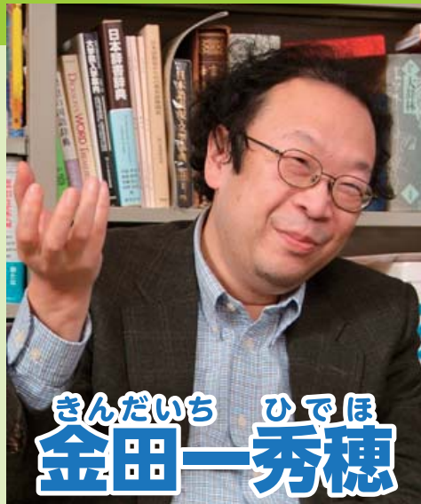
きんだいち ひでほ 金田一秀穂

杏林大学外国語学部教授。1953年東京都生まれ。日本語学専攻。ハーバード大学客員研究員を経て現職。祖父に日本語学の権威、金田一京助、父に方言研究で有名な金田一春彦を持つ。わかりやすく、かつ楽しく日本語を語る姿はメディアでもおなじみ。独特のキャラクターでテレビ出演も多数。