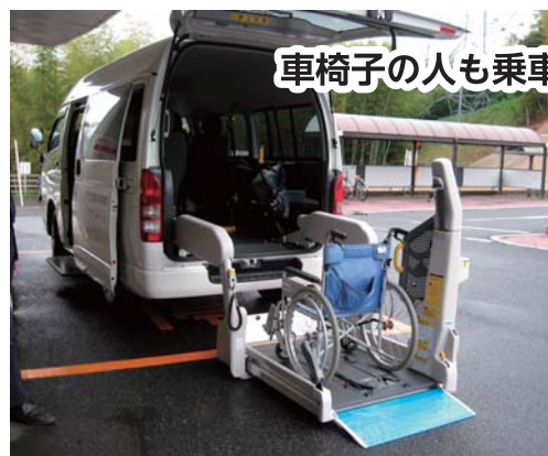
車椅子の人も乗車できます。