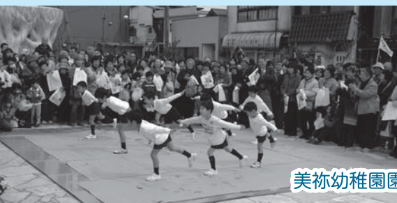
美祢幼稚園園児による演技

沿線での手振り応援は、大変好評で、ツアー参加者の良い思い出となったようです。ご参加いただいた皆さんご協力ありがとうございました。