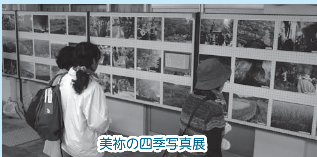
美祢の四季写真展