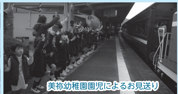
美祢幼稚園園児によるお見送り