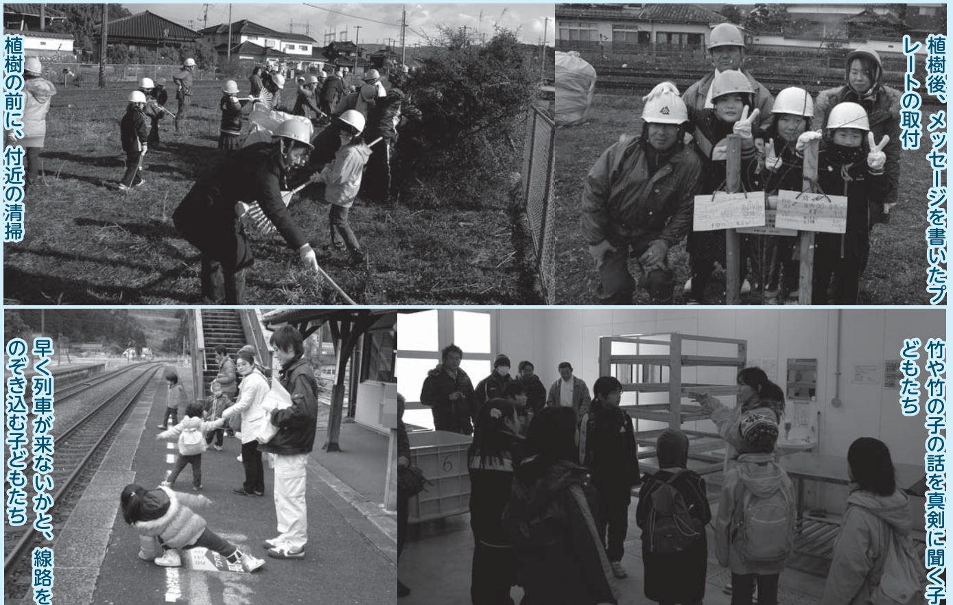
植樹の前に、付近の清掃

なお、この事業でイロハモミジを全部で8本植えました。美祿駅横ポケットパークからよく見えますので、紅葉の時期には、ぜひ、お立ち寄りください。