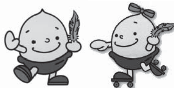
どんぐりくん どんぐりちゃん