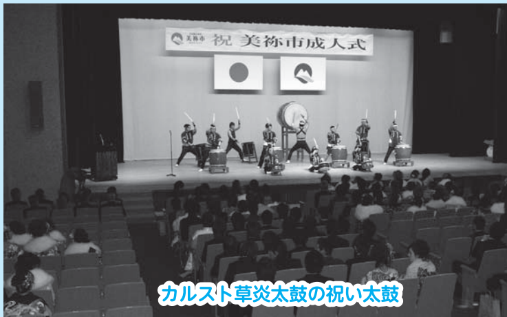
カルスト草炎太鼓の祝い太鼓