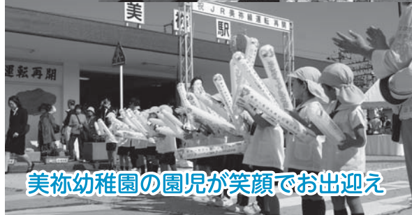
美祢幼稚園の園児が笑顔でお出迎え