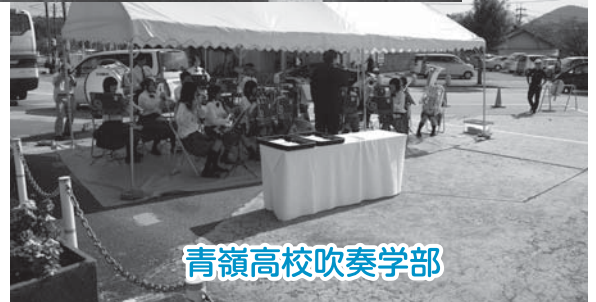
青嶺高校吹奏学部