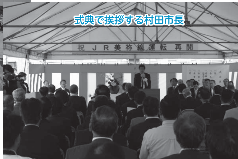
式典で挨拶する村田市長