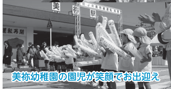
美祢幼稚園の園児が笑顔でお出迎え