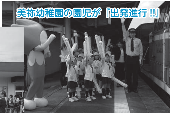
美祢幼稚園の園児が『出発進行!!!』

当日は、美祢線の沿線に多くの皆さんにでてください、心暖まる応援ありがとうございました。列車内では、市民の皆さんの心暖まる応援に乗客から歓声が上がっていました。