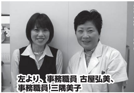
美東病院検診センター