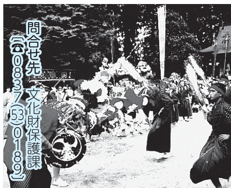
注進案に記録されています。

問合せ先 おいでませ!山口国体美祢市実行委員会事務局(国体推進課)〔☎0837(54)0011〕