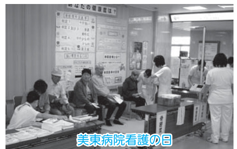
美東病院看護の日

それぞれの会場で、買い物等にいられた人や来院された人に、血圧、体脂肪、骨密度などを測定し、その結果から健康相談や栄養指導に応じていました。