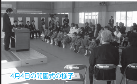
4月4日の開園式の様子

3月26日に、豊田前保育園が園舎移転に伴い閉園するため、卒園式と閉園式が開催されました。