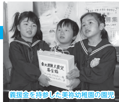
義援金を持参した美祢幼稚園の園児

なお、義援金は引き続き 4月末まで 受け付けていますので、皆さまのご協力をお願いします。