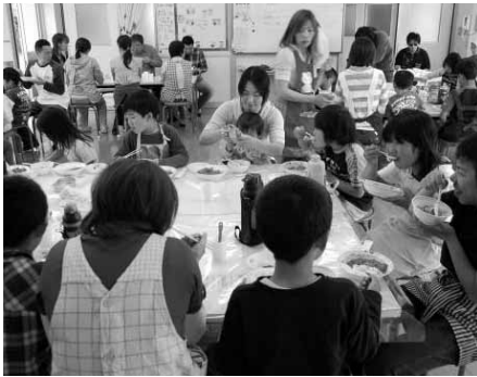
放課後子ども教室麦っこ塾