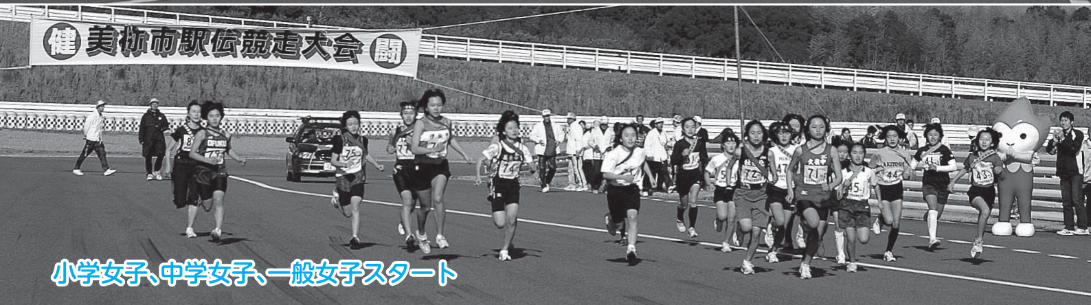
小学女子、中学女子、一般女子スタート