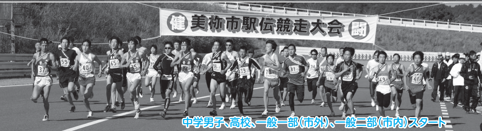
中学男子、高校、一般一部(市外)、一般二部(市内)スタート