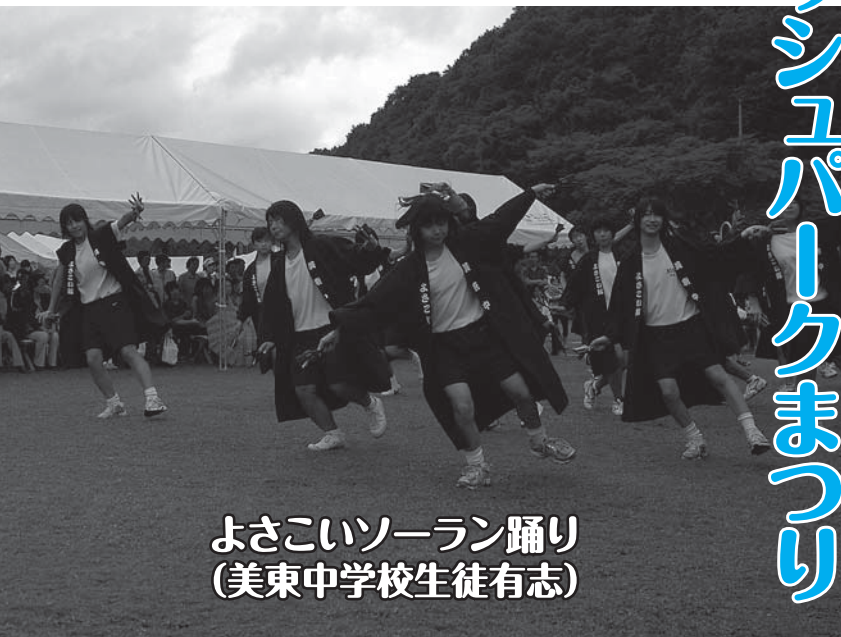
よさこいソーラン踊り (美東中学校生徒有志)