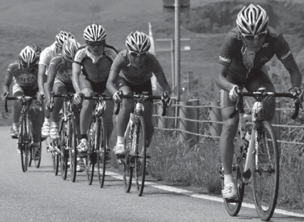
秋吉台を疾走する選手

また、大会当日は会場として使用した一般道に大規模な交通規制を設けたことで、交通渋滞等による多大なご迷惑を気にしておりましたが、市民の皆さまをはじめ、企業や各関係団体等の皆さまのご理解とご支援により、大きな混乱もなく、無事故で安全かつ円滑な競技会運営ができました。心から感謝申し上げます。この経験をもとに来年10月9日回の国体を更に充実するよう取り組みますので、市民の皆さまには国体市民運動等への積極的なご参加とご協力をお願いします。