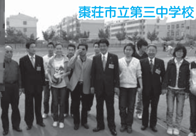
棗荘市立第三中学校