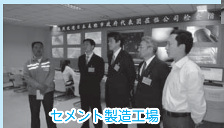
セメント製造工場