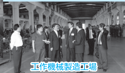
工作機械製造工場