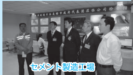
セメント製造工場