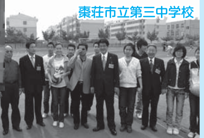
棗荘市立第三中学校