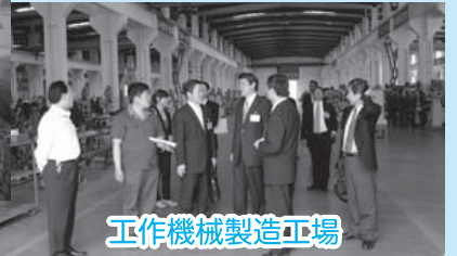
工作機械製造工場