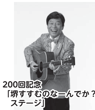
200回記念 「堺すすむのな〜んてか？ ステージ」