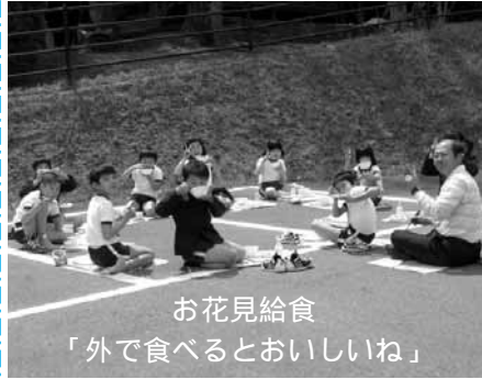
お花見給食 「外で食べるとおいしいね」

心のハーモニーを 目指して 重安小学校 校章には桜の花がデザイン され、学校は桜の木に囲まれ ています。先日、その満開