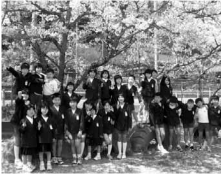
重安小 なかよし25人

心のハーモニーを 目指して 重安小学校 校章には桜の花がデザイン され、学校は桜の木に囲まれ ています。先日、その満開