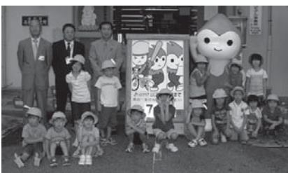
大田保育園園児の皆さん(本庁前)