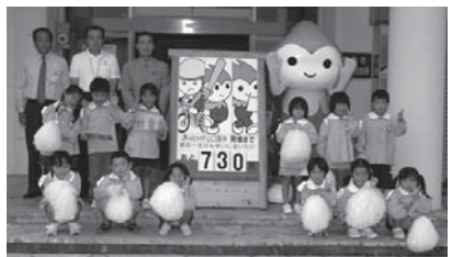
秋吉保育園園児の皆さん(本庁前)