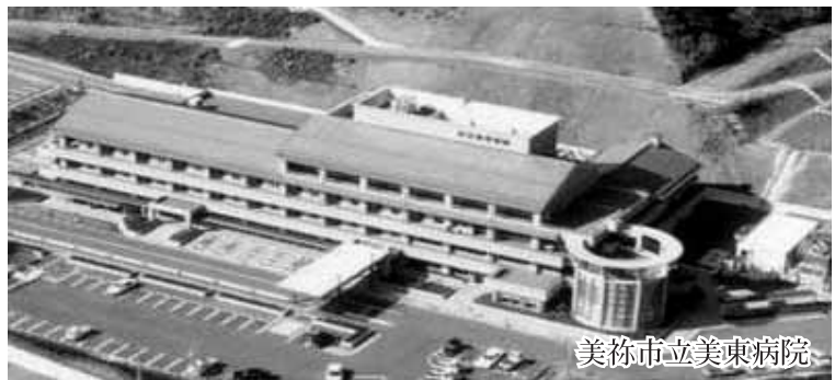
美祢市立美東病院