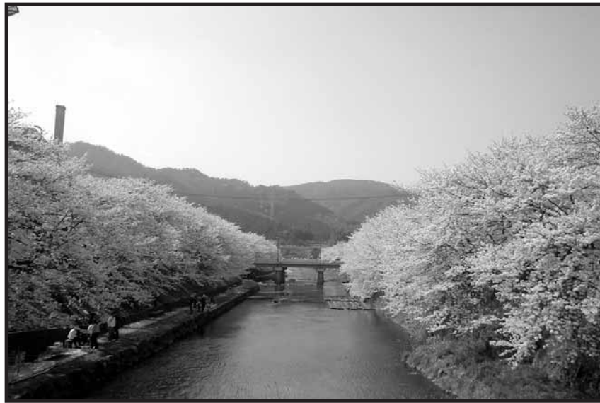
厚狭川沿いの桜並木 (美祢市大嶺町)

美祢市役所近くの厚狭川河川敷両岸には、約150本のソメイヨシノが植えられています。毎年4月の上旬に、桜まつりが行われ多くの花見客で賑わいます。開花の時期には夕方になると桜並木に飾られたちようちんに明かりがともされ、夜桜を楽しむことができます。