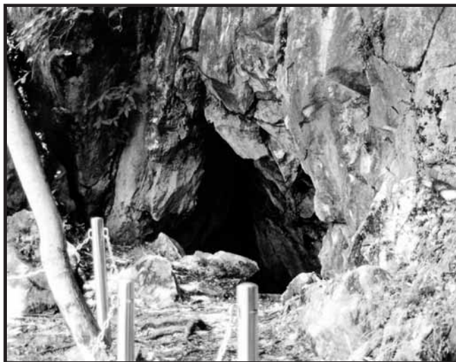
長登銅山跡 (美祢市美東町長登地内)

長登地区には、古くから奈良の大仏に関わる地名伝承が残っており、昭和47年に須恵器が発見されたことにより、奈良時代の鉱山跡であることが判明しました。昭和63年には、奈良東大寺大仏殿西隣の発掘調査によって出土した青銅塊の化学分析の結果から、大仏創建時の料銅は長登銅山産が使用されていたことが実証されました。 平成元年から行われた調査により、大量に出土した土器や木簡の文字史料から、8世紀から10世紀にわたって栄えた長門国直轄の採銅・製銅官衙（役所）跡であることが明確となり、日本最古の銅山跡であることが確認されました。 現地では、奈良時代の坑口や花の山製錬所跡、山神社などが見学できます。現地には資料館があり、発掘調査で出土した土器や鉱石、木簡などを展示しています。