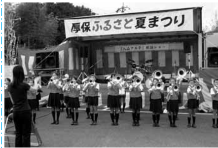
今年も夏祭りに出演！

「チャレンジ精神をもち、何 今年の生徒会の目標は、 美東中学校 全力の中学校生活 思い出の美東中に