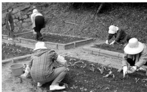
平原地区の花苗植え付け風景

特色ある教育活動と しての「英語活動」 大嶺小学校 授業では、「What is this?」「 これはなんですか?」「 Where are you from? (ど この国からきましたか?)」 などの英語表現を行います。 ゲームなどを通して英語に親 しむと同時に、友だちとの言 語を通じたコミュニケーション の楽しさを味わいます。 「文化理解コーナー」では、 外国の生活や文化を映像や写 真を用いて紹介する中で、自 分たちの生活や文化と比較し、 質問をしたり、考えたりしな う。