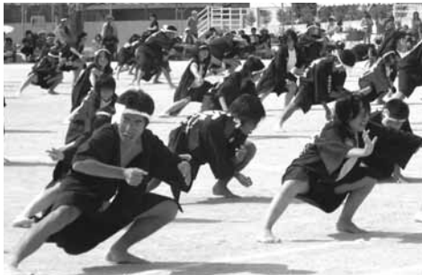
よさこいソーラン

「チャレンジ精神をもち、何 今年の生徒会の目標は、 美東中学校 全力の中学校生活 思い出の美東中に