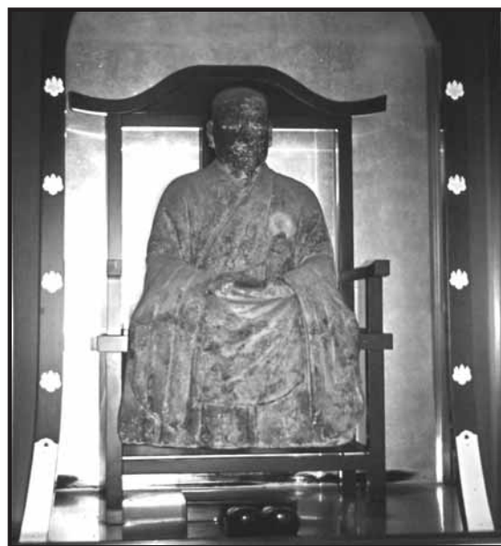
塑造寿円禅師坐像 (そどうじゅえんぜんじごどう)

秋吉里の自往寺を禅寺として開いた寿円禅師の坐像は、円頂(えんちよう)、衲衣(のうえ)をつけ袈裟をかけ、禅定印を結び、衣のすそや袖を前にたらしめて座る頂層形式の肖像である。