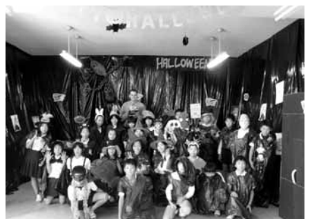
大嶺小ハロウィン

美称市をより良いまちにする ため、市民の皆さんのさら なるご理解とご協力をお願い します。