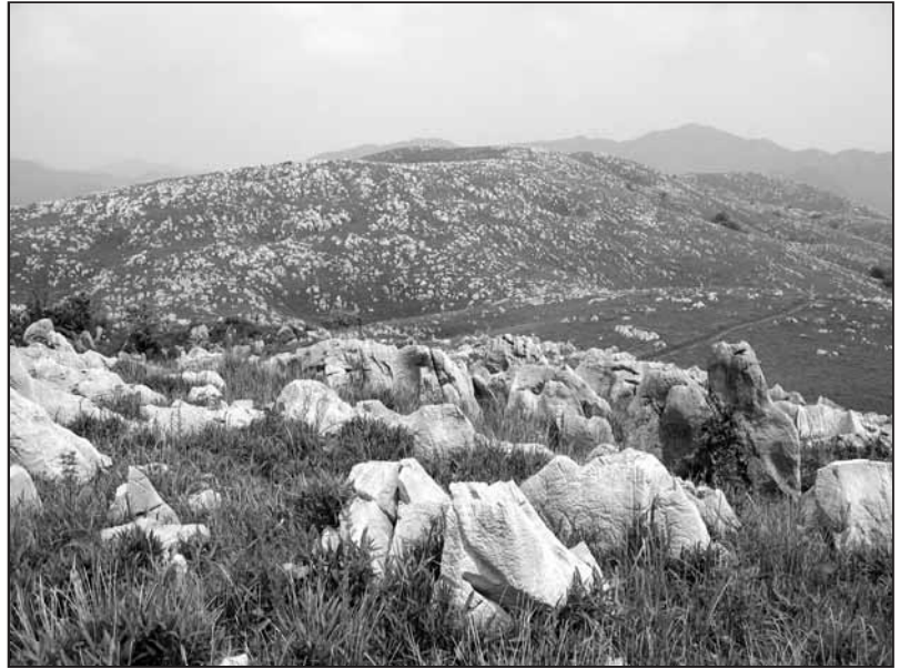
秋吉台のカルスト台地

秋吉台は、はるか昔、遠い海でサンゴ礁として誕生しました。それから約3億5千万年、ドリリーネや鍾乳洞が発達した石灰岩の台地、カルスト台地となりました。石灰岩の中にはサンゴ、ウミユリなどの地球と秋吉台の長い歴史を示す化石が見つかります。