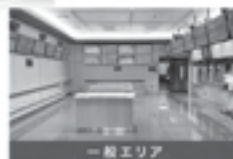
一般エリア 競走観戦やレースを立見でチェックしながら、ドリンクバーで楽しめます。