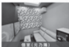
個室(光力機) 全室にモニターを完備! 机上にモニターで競走も観戦! レース実況やリアルタイム競走情報を見ることもできます。