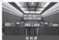
有料席 一帯ひとくくられるスペースに、フリードリンクコーナーをご用意。ご利用の方は受付まで。