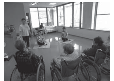
地域のボランティアの方々によるレクリエーションも行っています。

安心して入院生活が送れるように、また、在宅復帰や施設入所など退院が目指せるように、医療スタッフと連携しながら看護・介護を提供しています。