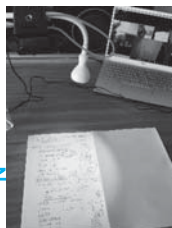
【数学Ⅲ】のオンライン授業の様子 (在宅勤務)

教職員については、新型コロナウイルス感染症の感染拡大防止の観点から、出勤者数が5割程度となるよう在宅勤務を行いました。