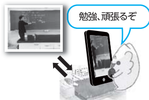
【生物】の授業の様子

教職員については、新型コロナウイルス感染症の感染拡大防止の観点から、出勤者数が5割程度となるよう在宅勤務を行いました。