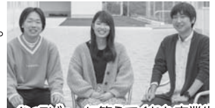
インタビューに答えてくれた卒業生