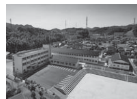
ドローンによる校舎撮影

令和2年度は普通科65人、総合ビジネス科53人、合計118人の新入生を迎え、全校生徒273人が、新校舎のもとで新たな学校生活をスタートさせました。