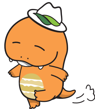
美祢市公式キャラクター 「ミネドン」