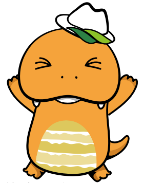
美祢市公式キャラクター 「ミネドン」