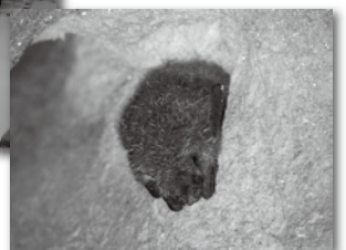
洞窟内のテングコウモリ