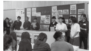
英語によるジオガイド

○今年一年、応援していただきありがとうございました。来年もよろしくお願いたします。