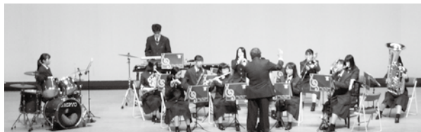
平成30年度のオープニングイベント(ステージ発表)