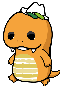
美祿市公式キャラクター 「ミネドン」