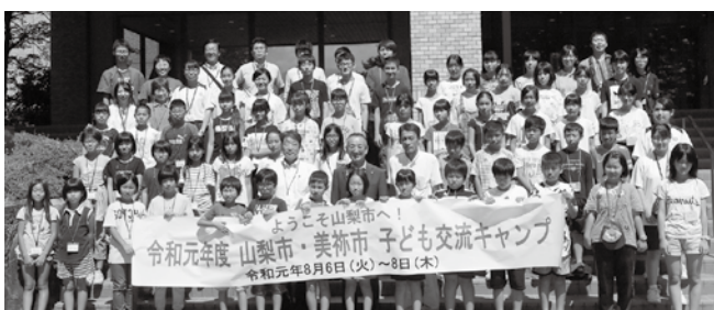
ようこそ山梨市へ！ 令和元年度 山梨市・美祢市 子ども交流キャンプ 令和元年8月6日(火)～8日(木)