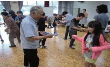
地域の皆さんと一緒にゲーム(於福公民館)