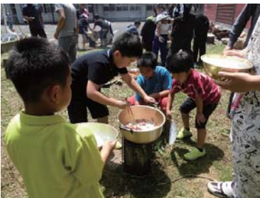
カンテキでカレーづくり(麦川小学校)