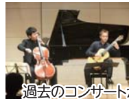
過去のコンサートから

問い合わせ先 秋吉台国際芸術村事業企画課 ☎0837(63)0020 ☎0837(63)0021 ✉info@aiav.jp