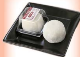
生クリーム大福餅