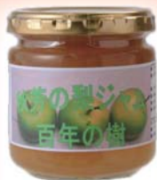
秋芳の梨ジャム 百年の樹