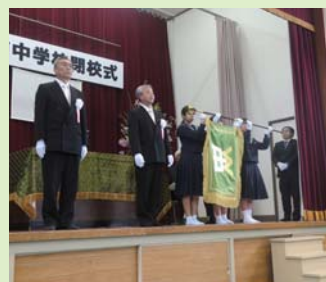
豊田前中学校閉校式

閉校式には、地域や学校にゆかりのある人々など多くの参加があり、それぞれの思いを馳せていました。