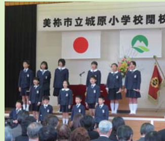
城原小学校閉校式