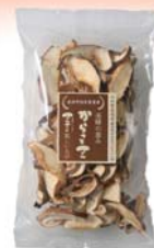
乾しいたけ からつとさん