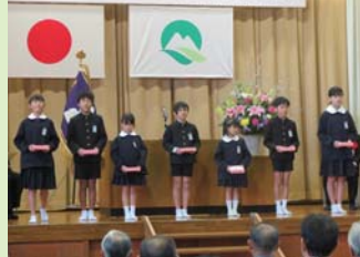
赤郷小学校閉校式