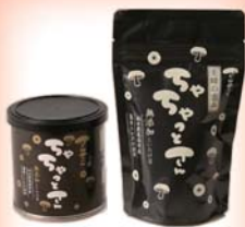
しいたけ茶 ちやちやつとさん