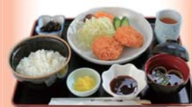
美東ごぼう コロッケ定食