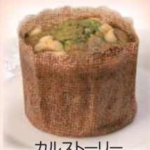
カルストーリー Kar Story (ほうれん草のカップケーキ)