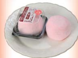
生クリーム大福餅 いちご