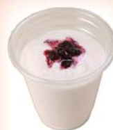
ブルーベリー ヨーグルト スムージー