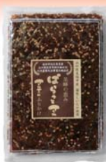
ふりかけ ばらつとさん