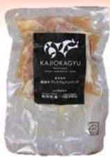
梶岡牛 プレミアムハンバーグ