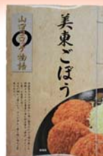
山口コロッケ物語 美東ごぼうコロッケ