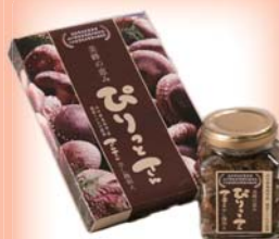
辛し麩和え ぴりつとさん