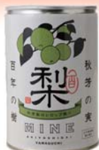
秋芳の梨 百年の樹