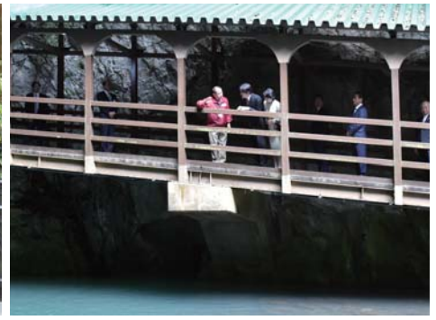
(写真は秋芳洞入口)