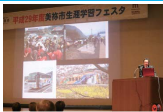
昨年のオープニングイベント (ステージ発表)の様子