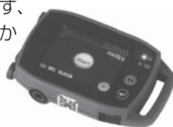
睡眠時無呼吸検査装置ソムノタッチRESP

不眠症やいびきでお悩みの人、又はご家族など周囲の人にいびきのことなどで心配されている人は、ぜひ一度ご相談ください。