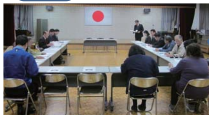
【4月18日 於福小・中合同学校運営協議会】