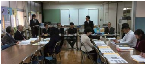
【4月13日 伊佐小・中合同学校運営協議会】