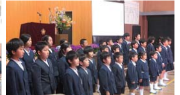
別府小学校閉校式