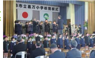
嘉万小学校閉校式

閉校式には、地域の皆さん、学校にゆかりのある方々など多くの参加があり、別れを惜しんでいました。