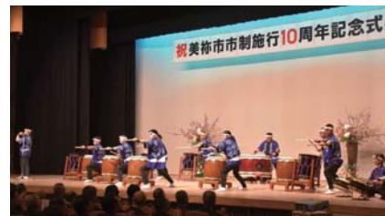
カルスト草炎太鼓による演奏