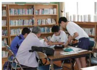
テスト前補習（学校支援）

本校では、小・中合同学校運営協議会を核とし、子どもたちの9年間を見通した「豊かな学びや育ち」を支援するため、委員、教職員、PTA役員が三位一体となって重点施策等を協議し、進めています。協議したことを実践につなげる『学校運営』、地域や保護者の方々のサポートによる『学校支援』、そして、地域のために生徒や教職員が感謝の気持ちを込めて活動する『地域貢献』…この3つの機能のバランスを大切にしながら、活力あるコミュニティ・スクールとして、さらに進んでいきたいと思っています。