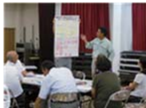
あつまロンネット研修会

「熟議」は、学校・家庭・地域の連携強化に向けて、学校や地域の課題を共有し、様々な立場の皆さんと一緒に課題解決をめざします。熟議を通して、地域でどのような子どもを育てていくのか、何を実現していくのか、目標達成に向けた具体的取組につなげていきます。