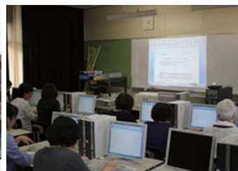
パソコン講座（地域貢献）