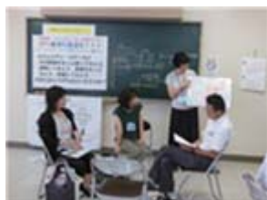
秋芳ゆめコムスク協議会