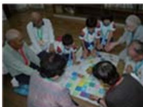
昔の遊び集会(於福小)