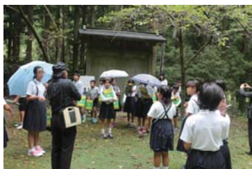
ふるさとの史跡巡り