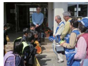
見守り隊と対面(綾木小)