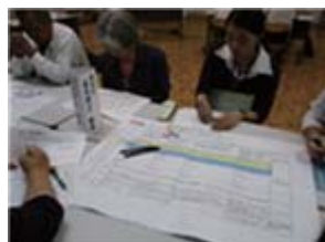
於福小・中学校運営協議会