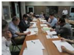
豊田前小・中学校運営協議会