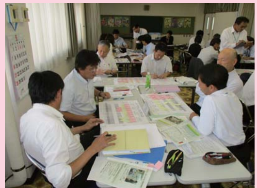
中学校区ごとに具体的な取組みを 話し合う教頭先生の皆さん

子どもの育ちや学びを小中の連携、地域の支援により、9年間のつながりのある地域学習計画表を作成しました。「ふるさとを愛する心の育成」をめざし、小学校と中学校が綿密に連絡を取り合いながら、よりよい教育活動を進めていきます。