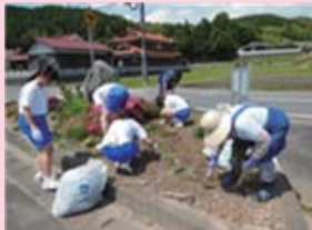
厚保小周辺の花壇整備

児童生徒や保護者、地域の人が多く参加して地域環境整備活動を行いました。厚保小周辺の花壇や神社・通学路の整備、旧川東小や旧東厚小の花壇やグラウンドの除草などそれぞれの地域に分かれて実施し、地域との連携・協働が高まりました。