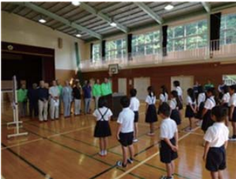
チーム城原・防犯城原の 皆さんとの対面式