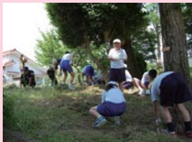
旧川東小環境整備