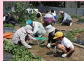
旧東厚小環境整備