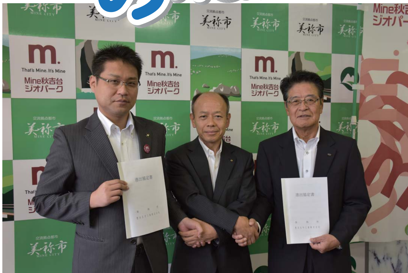
写真左側から西岡市長、大谷県商工労働部長、杉浦代表取締役社長