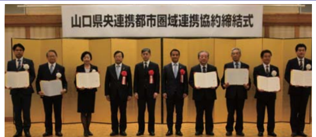
左から美祢市長、山陽小野田市長、宇部市長、島根県副知事、総務省自治行政局市町村課長、山口県知事、山口市長、防府市長、萩市長、津和野町長

今後、7市町は、協約書に掲げる分野について、相互に連携や補完を図り、圏域全体の更なる活力につなげていく取組を進めていきます。