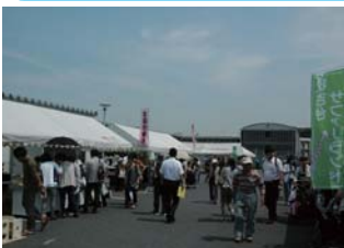
毎年多くの来場者でにぎわっています。