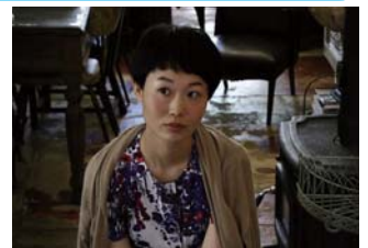
「ジジ・オラル」さんのライブなどステージイベント盛りだくさん！