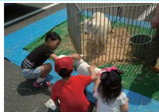
ふれあい移動動物園もあり子どもたちも楽しめます。