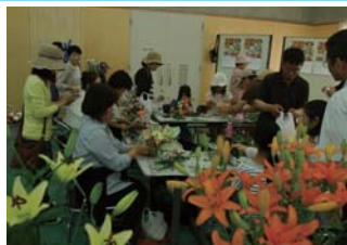
フラワーアレンジメントなどの体験コーナーも充実！