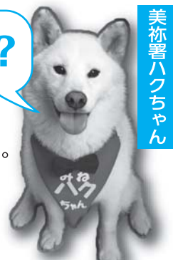
美祢署ハチちゃん