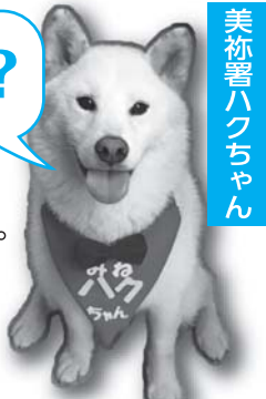
美祢署ハクちゃん

ゾーン30とは? 生活道路が集積している区域を「最高速度30km/h」に規制して、通学・通勤等の歩行者や自転車運転者等の安全確保を優先した各種交通事故防止対策を行うものです。